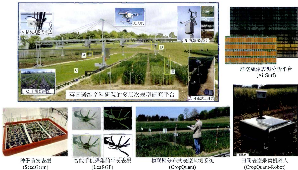
图2 英国诺维奇科学研究院使用的多层次作物表型平台

同开发的高通量室内水稻表型设施 (high-throughput rice phenotyping facility, HRPF) [38] , 德国 IPK 和浙江大学生命科学学院共同研发的基于 LemnaTec 系统的高通量植物生长和干旱反应分析系统 [39] 。本文将着重介绍讨论各类田间作物表型技术。